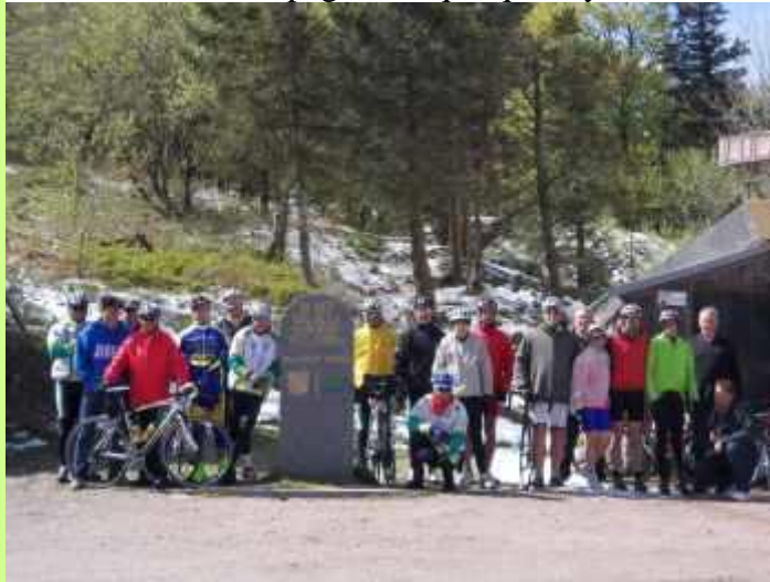
Photo pour immortaliser cette dernière ascension du périple. Après Munster, tous ces cyclos roulent ensemble, avec une nouvelle crevaision pour pimenter ce bout de route.

Là, les accompagnateurs alsaciens leur concoctent un excellent ravitaillement, leur permettant de reprendre des forces avant de descendre sur Munster en compagnie de quelques cyclos bennwihriens.